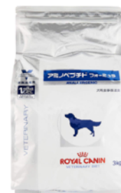
Anallergenic/Ultamino (Royal Canin)